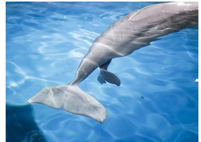
赤ちゃんの尾ビレ出現