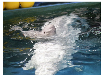
支えられて呼吸する様子